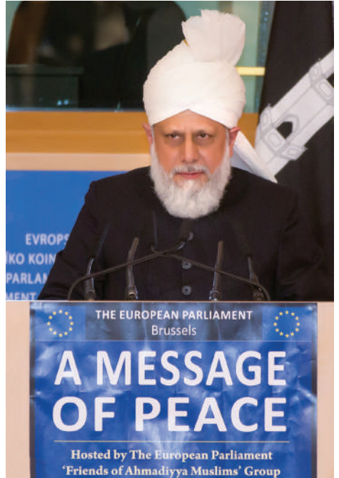
Haqrat Mirza Masroor Ahmad, Khalifatul-Masih V aba delivers the keynote address at the European Parliament event