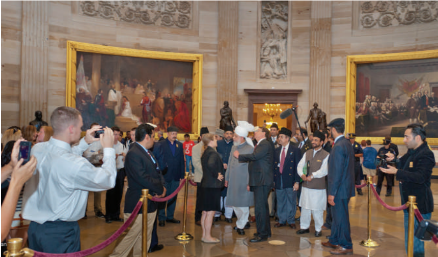
Hadrat Khalifatul-Masih V aba during his official tour of U.S. Capitol Hill