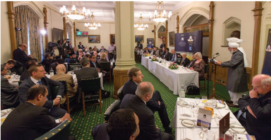
Hadrat Khalifatul-Masih V aba delivering his historic speech to Parliamentarians, VIPs and diplomats at the House of Commons, London, 11th June 2013