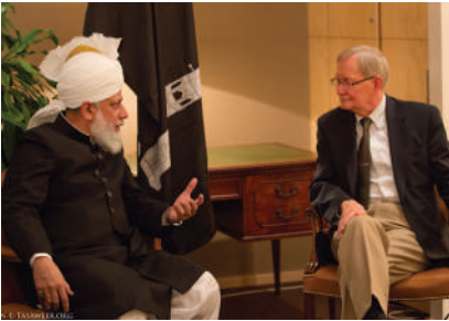
Tunne Kelam (MEP Estonia & Vice-Chair of European Parliament Friends of Ahmadiyya Muslims Group) meeting with His Holiness