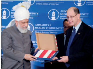
Brad Sherman (Democratic member of the United States House of Representatives) presenting American flag to Ҳадрат Khalifatul-Masih V aba