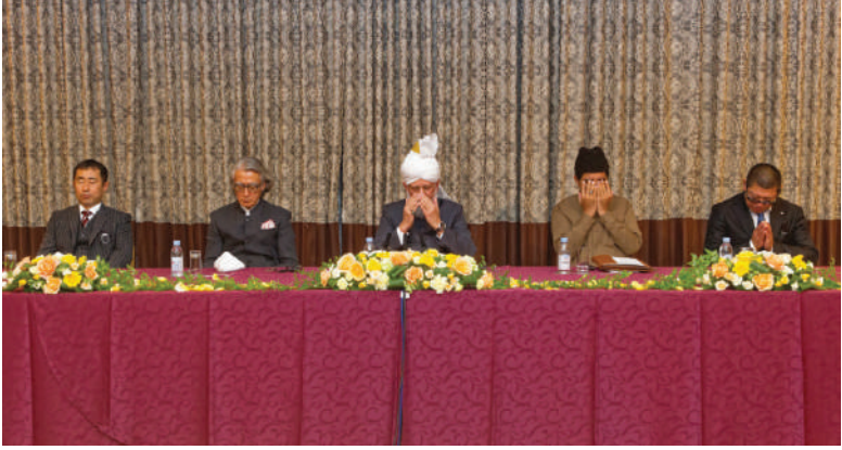
हजरत खलीफतुल मसीह पंचम अय्यदहुल्लाहु तआला बिनसिहिल अजीज का टोकियो, जापान में विशेष आयोजन में दुआ कराने का दृश्य