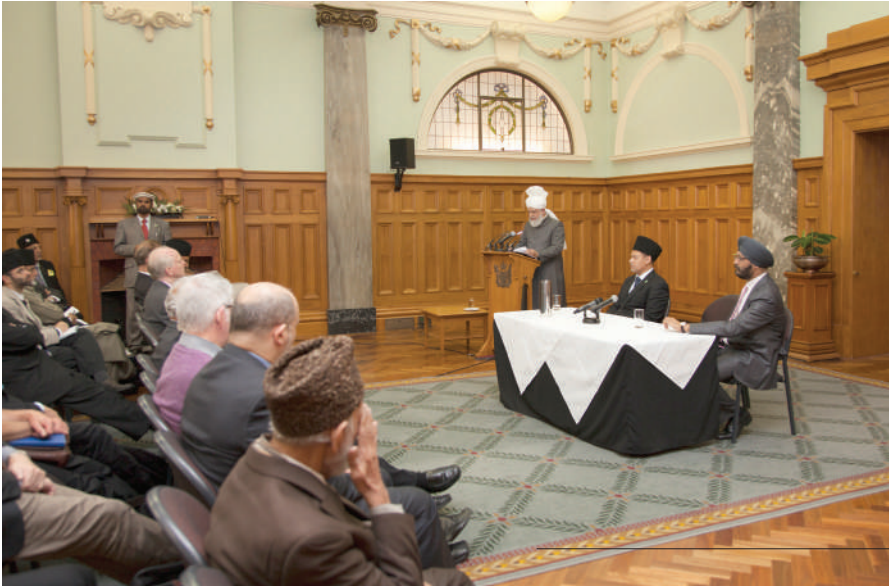
Ḥādrat Khalifatul-Masiḥ V aba delivering the keynote address at the Grand Hall, in the New Zealand Parliament. 4th Nov 2013