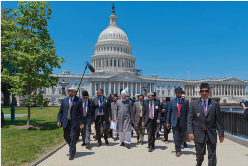
Hadrat Khalifatul-Masih V aba in U.S. Capitol Hill after his historic address to the US Statesmen and Bureaucrats