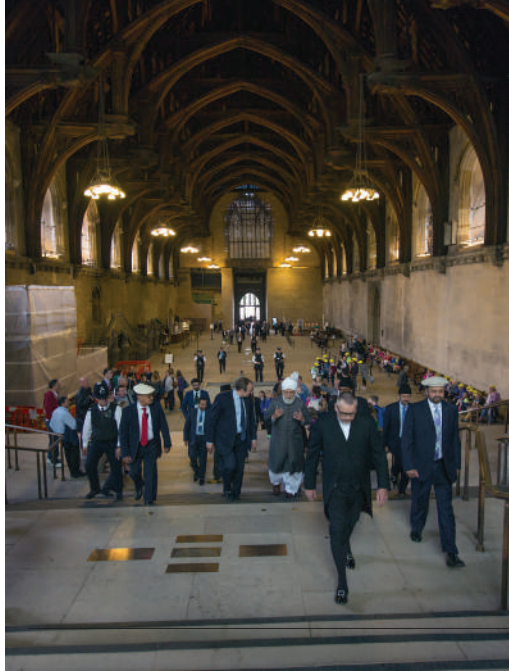
Rt Hon Ed Davey MP escorts Hadrat Khalifatul-Masih V aba through Westminster Hall, House of Commons, London, 11th June 2013