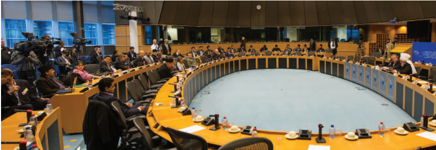
Press Conference with Hadrat Khalifatul-Masih V aba at European Parliament. Seated with His Holiness is Dr. Charles Tannock (MEP-UK and Chair of European Parliament Friends of Ahmadiyya Muslims Group)