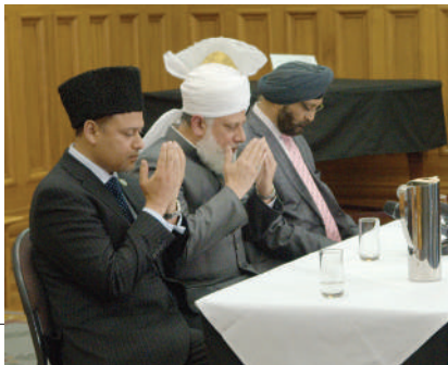
Ḥadrat Khalifatul-Masih V aba leading silent prayers at the conclusion of the official function in the Grand Hall, New Zealand Parliament