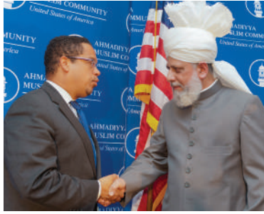
The first Muslim Congressman, Keith Ellison meeting Ҳадрат Khalifatul-Masih V aba