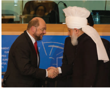
Haqrat Khalifatul-Masih V aba being welcomed by Martin Schulz, President of European Parliament