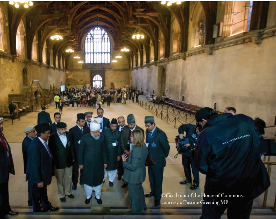
Official tour of the House of Commons, courtesy of Justine Greening MP