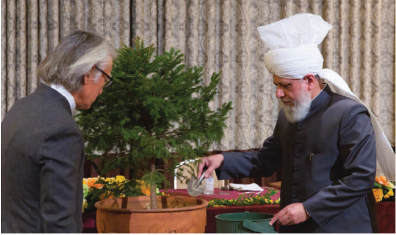
हजरत खलीफतुल मसीह पंचम अय्यदहुल्लाहु तआला बिनसिहिल अजीज टोकियो जापान में आयोजित विशेष आयोजन में पौधे को सींचते हुए