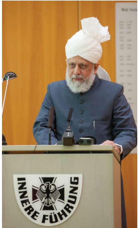
Hacırat Khalifatul-Masih V aba addressing the German Federal Army