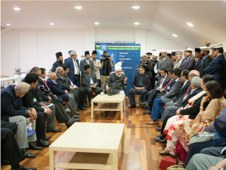
Ḥaḍrat Mirza Masroor Ahmad, Khalifatul-Masih V aba talking to the overseas Pakistani press regarding world affairs