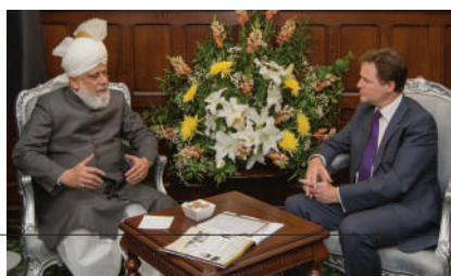
The Deputy Prime Minister, Rt Hon Nick Clegg in discussion with Hadrat Khalifatul-Masih V aba , House of Commons, London, 11th June 2013