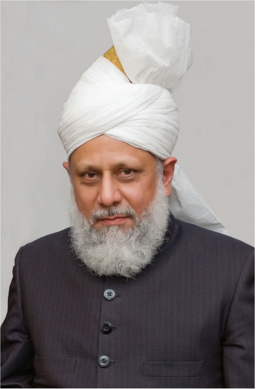
हज़रत मिर्ज़ा मसरूर अहमद खलीफ़तुल मसीह पंचम