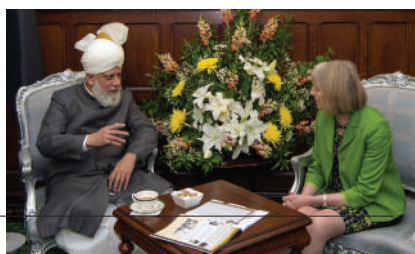
The Home Secretary, Rt Hon Theresa May MP with Hadrat Khalifatul-Masih V aba