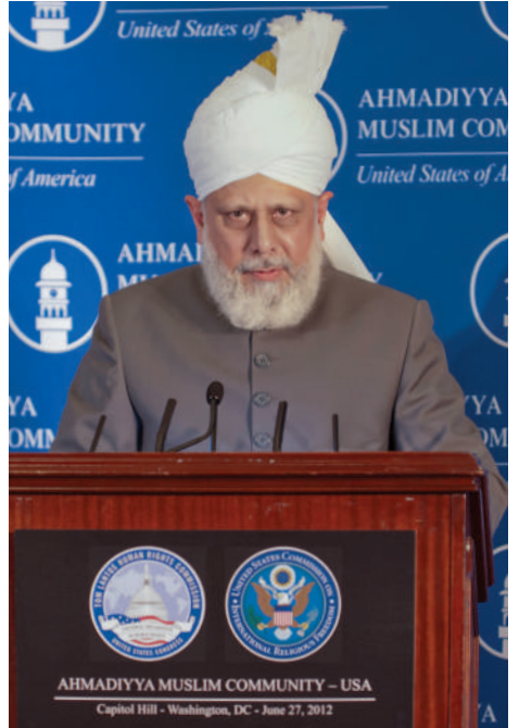
Ҳадрат Mirza Masroor Ahmad, Khalifatul-Masih V aba delivers his keynote address at U.S. Capitol Hill