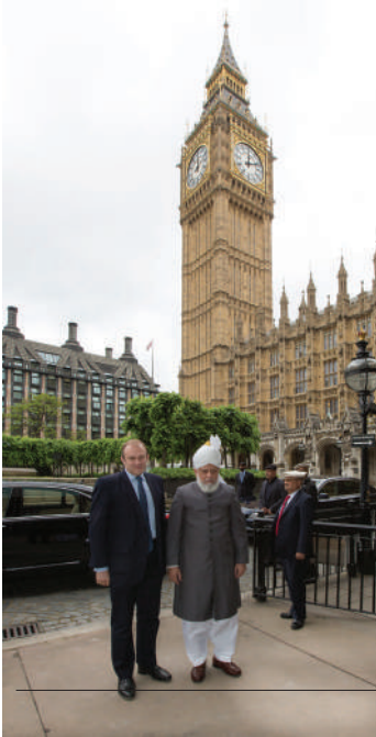
Hadrat Khalifatul-Masih V aba received at the House of Commons by Rt Hon Ed Davey MP London, 11th June 2013