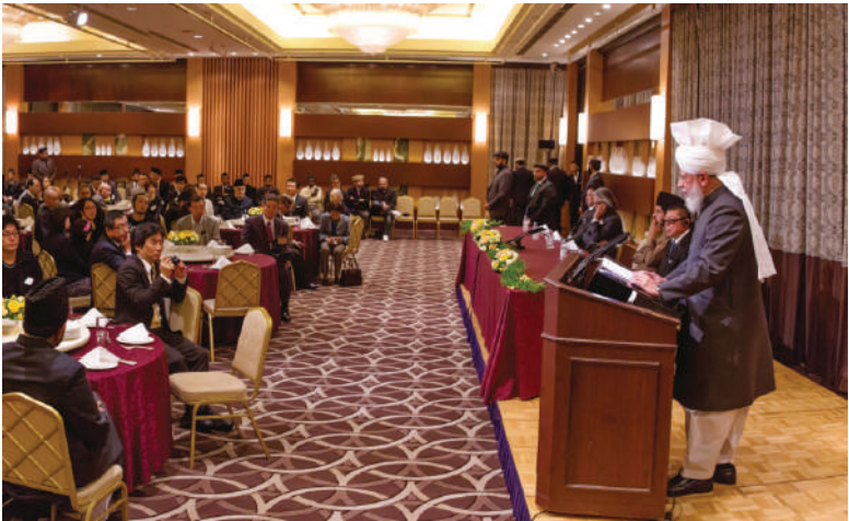
हजरत खलीफतुल मसीह पंचम अय्यदहुल्लाहु तआला बिनसिहिल अजीज टोकियो जापान में आयोजित विशेष आयोजन में केन्द्रीय भाषण देते हुए