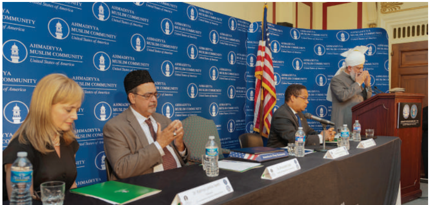
Ҳадрат Mirza Masroor Ahmad, Khalifatul-Masih V aba leading silent prayer at U.S. Capitol Hill