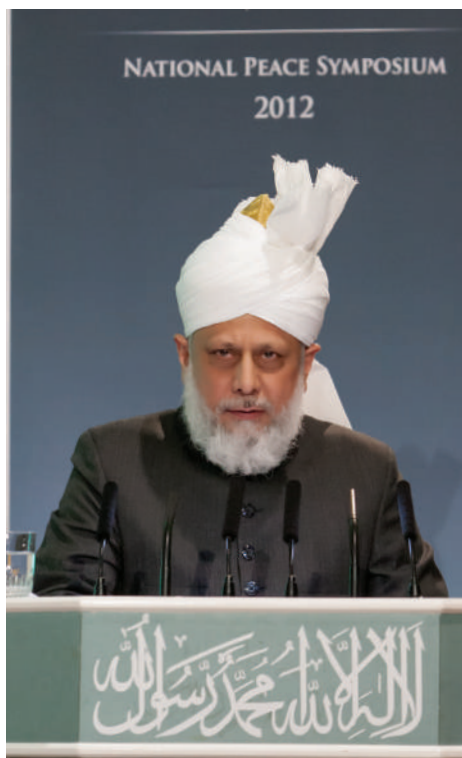
Ḥaḍrat Mirza Masroor Ahmad, Khalifatul-Masiḥ V aba addressing the 9th Annual Peace Symposium