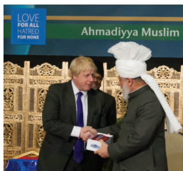
Mayor of London Boris Johnson presenting His Holiness with a London bus souvenir